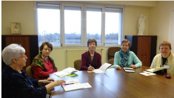
Grande Bretagne & Irlande

Dans l'après-midi , les participantes ont travaillé dans leurs propres équipes en regardant le contexte global / particulier et notamment les opportunités et les défis auxquels elles sont confrontées.