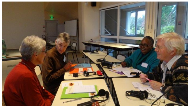
Afrique du Sud