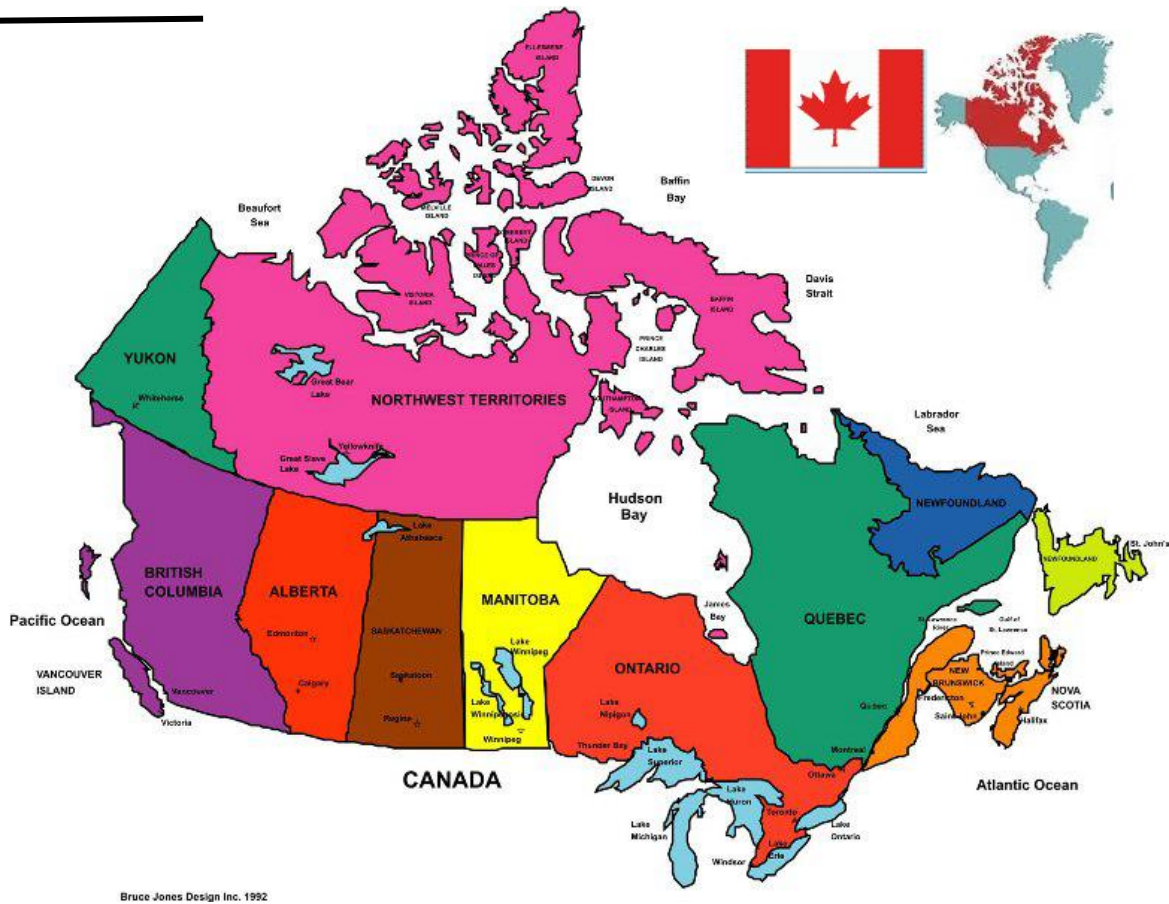
Bruce Jones Design Inc. 1992

E l Canadá es tan grande que nuestra Sagrada Familia solo ha podido explorar una mínima parte, situada al Este, en la Provincia de Quebec. Si nos situamos en 1901 podemos maravillarnos viendo llegar a nuestras fundadoras, ocho mujeres de carácter y corazón de fuego, que afrontan este país de nieve en difíciles condiciones, porque Canadá comenzaba a vivir la era industrial y las necesidades sociales eran enormes.