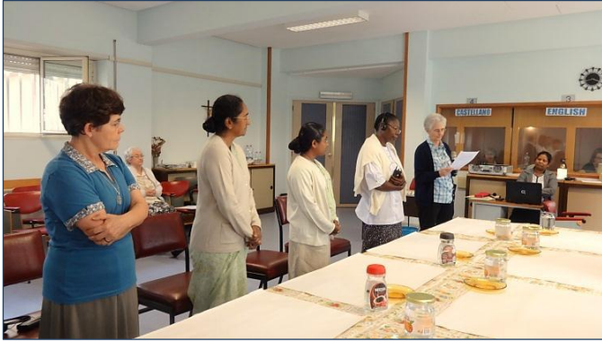
Entrando en el espacio sagrado con atención

Por la noche, las participantes, disfrutaron de un tiempo de autoexpresión libre por medio de la pintura.