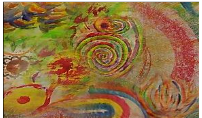
Expresando sueños en color con creatividad

A Partir del 7 de abril por la tarde hasta el 9 por la noche, los miembros del equipo tuvieron un tiempo de profunda reflexión, conversación e intercambio sobre la Nueva Historia del Universo. También vieron cómo aplicarlo a la formación Sagrada Familia.