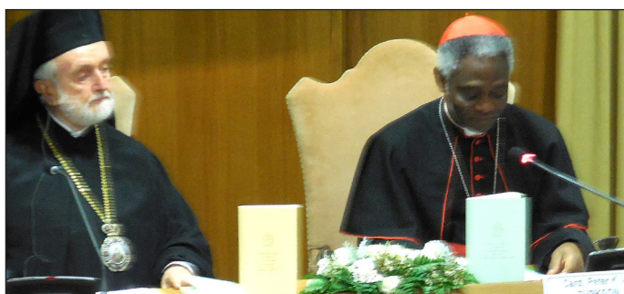
Laudato Si fue acogida con entusiasmo en una conferencia de prensa organizada por el PCJP. El Metropolitano John Zizioulas, representante del Patriarca Ecuménico Bartolomé, expresó “que es un motivo de gran alegría y satisfacción para los ortodoxos”, y el Cardenal Turkson agradeció a los medios su presencia en una ocasión tan trascendental. Algunos Promotores de JPIC estuvieron presentes en el evento. were present at the event.

1.4 Gracias, Papa Francisco, por Laudato Si . Una manifestación ecuménica marchó con entusiasmo desde la Embajada Francesa hasta la Plaza San Pedro para agradecer al Papa Francisco por Laudato Si . El Papa Francisco saludó a los participantes y expresó una cordial gratitud por el compromiso que expresaban.