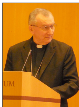
El Secretario de Estado Cardenal Pietro Parolin hablando a la asamblea sobre la importancia de la encíclica para la Iglesia y el Mundo.

1.5 Seminario de CIDSE—Las personas y el planeta en primer lugar: el imperativo de cambiar el rumbo. La celebración del 50° aniversario de la creación de CIDSE, que tuvo lugar el 2-3 de julio de 2015, fue una oportunidad para reflexionar y estimular el debate sobre Laudato Si . CIDSE , Alianza Internacional de Organizaciones de Desarrollo Católicas que trabajan juntas por la justicia mundial, promueve muchos de los aspectos tratados en la encíclica. El acto incluyó