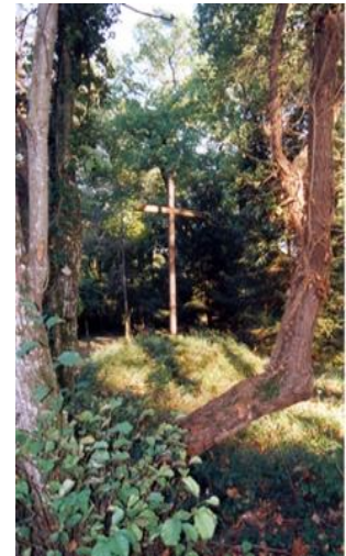
Cruz de Solo Dios, Martillac

Vivir los valores de la Sagrada Familia: comunión, primacía de Dios, disponibilidad, interrelación, presencia, acogida, servicio a los demás