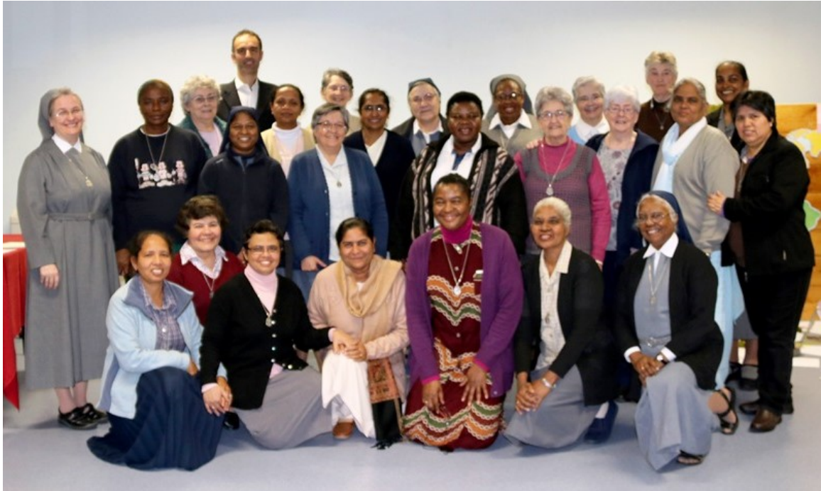
Las participantes del CGA